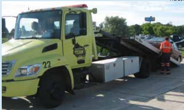
Pab Neeg Saib Xyuas Tsheb Raws Txoj Kev Loj yog zoo li hom tsheb loj sib cab.

Teebmeem: Thaj chaw ua haujlwm raws kev yuav nqaim thiab nyuaj rau cov neeg khiav tsheb mus los nyob hauv Ib Cheeb Tsam Winnebago. Kev daws teebmeem los ntawm WisDOT: muaj Pab Neeg Saib Xyuas Raws Txoj Kev Loj.